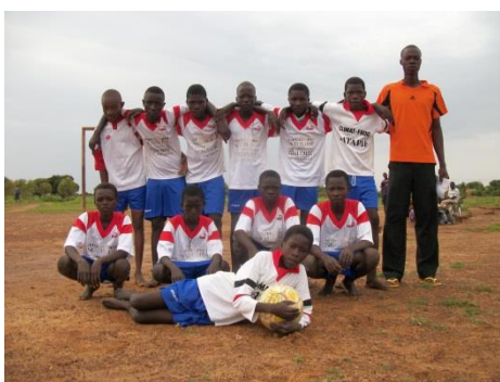
les 12 - 17 ans

Malgré l'autonomie financière de l'association, il nous manquait des équipements de base comme les maillots, les shorts et les chaussettes pour les deux catégories. Nous avons donc frappé à la porte de plusieurs clubs de la région toulousaine, et 3 d'entre eux, « Blagnac, Cugnaux et Muret » nous ont offert les équipements souhaités. Il nous fallait maintenant acheminer ces équipements sur place et les ONG françaises « Hydraulique Sans Frontières », « Un projet pour Réo » et « FASSOL », ont répondu présentes pour nous soutenir logistiquement. Les équipements non utilisés par l'ANFC sont remis sous forme de récompense à la fin du tournoi ou vendus au marché pour générer une rentrée d'argent supplémentaire dans la caisse de l'association.