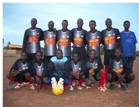
les plus de 18 ans