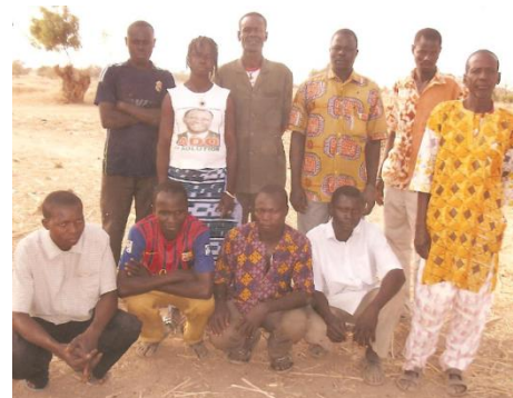
Le bureau ANFC

Depuis quelques années, de nombreux jeunes du village de Namoukouka se réunissaient pour pratiquer le football après les travaux agricoles. Cependant, malgré leur volonté de jouer régulièrement, ils devaient faire face à de nombreux problèmes, comme le renouvellement des ballons et le manque d'organisation. Finalement, les jeunes du village se sont regroupés et l'association des Aigles du Namoukouka Football Club a vu le jour en 2011. Les cotisations des joueurs ont permis de financer les dépenses quotidiennes (ballons, déplacements), et le club compte aujourd'hui 40 licenciés.