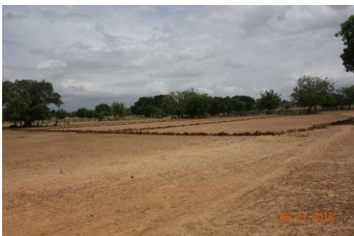
La parcelle agricole délimitée

60 villageois ont été formés pendant deux semaines par un agronome au mois de mai avec un volet théorique et pratique. Début juin, la parcelle a été délimitée par des cordons pierreux et a été divisée en deux pour la zone test et la zone témoin. Différentes techniques ont été mises en place, comme les demi-lunes et le zai. Deux fosses de compostage ont été creusées à une profondeur de 60 centimètres. Les semis de mil, de sorgho blanc et d'haricots ont été réalisés fin juin et le périmètre volailler sera opérationnel après la saison des pluies en septembre. Enfin, 2 membres du bureau vont être formés sur l'élevage dans les semaines à venir.