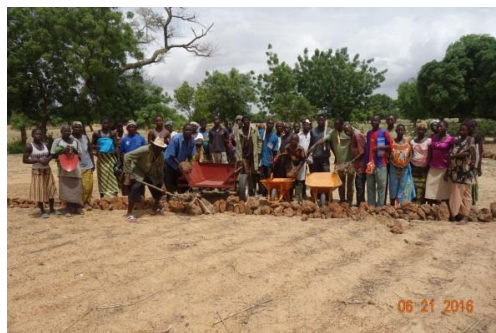
Les membres de l'association en mobilisation