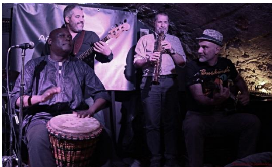
Le concert au Stage de février

L'association Laagm Taaba est heureuse de vous annoncer que nous avons récolté 5800 euros pour la mise en place de notre projet agricole. Un très grand merci à vous tous pour votre soutien, vous avez été une cinquantaine de donateurs. Nous souhaitons également remercier nos partenaires, dont 3 structures pour leur soutien financier, l'ONG Alizeta, l'association Helping Hands et l'ONG ADE, mais aussi le café théâtre « the stage » qui nous a accueilli pour organiser une soirée-concert de levée de fonds, ainsi que plusieurs médias qui nous ont permis de communiquer sur la campagne, dont Africaraiibe 06, France bleu Azur, Nice Matin et TMC.