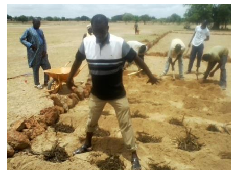
La technique du zai