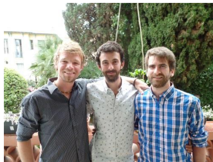
Les membres du bureau à Nice